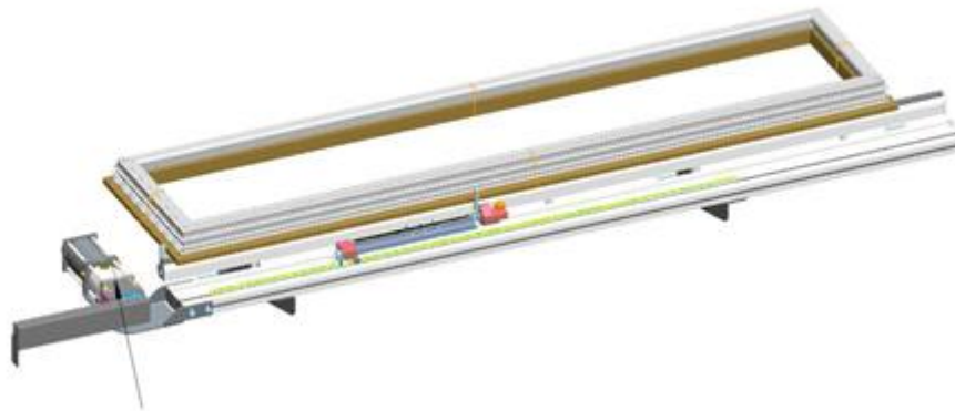
Punzonadora a petición